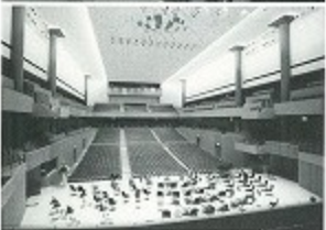
1.シューボックス型 2.ワインヤード型 3.現代型