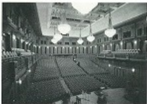
シューボックス型